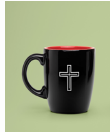
Cross Mug B £3.99 Buy | View