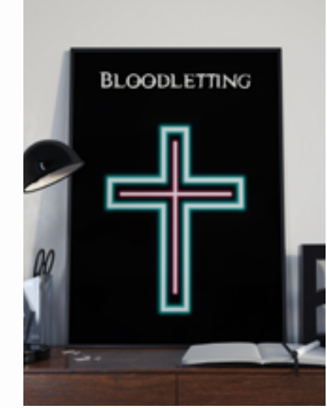
Poster 3 £2.99 Buy | View