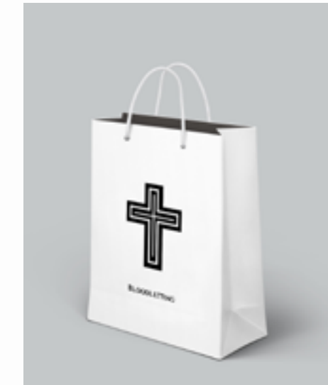
Cross Bag £1.99 Buy | View