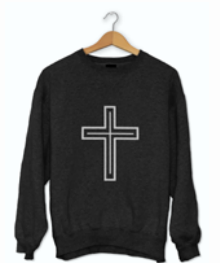
Cross Jumper £10.99 Buy | View