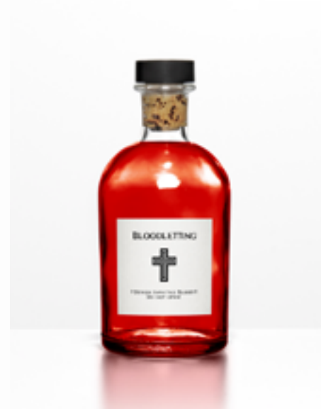
Demon Blood £4.99 Buy | View