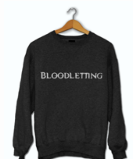
Title Jumper £10.99 Buy | View