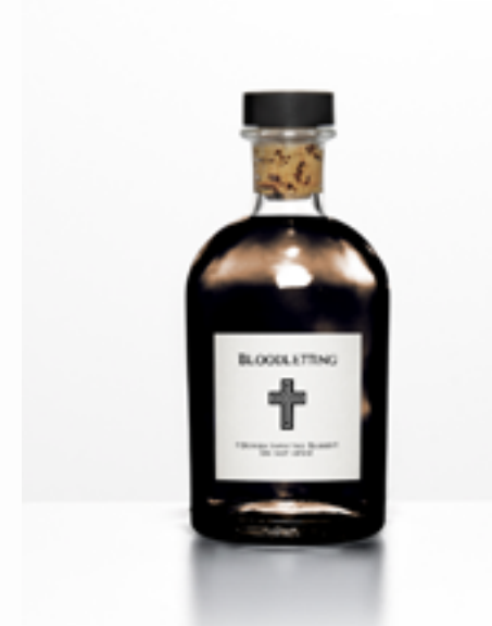
Potion £4.99 Buy | View