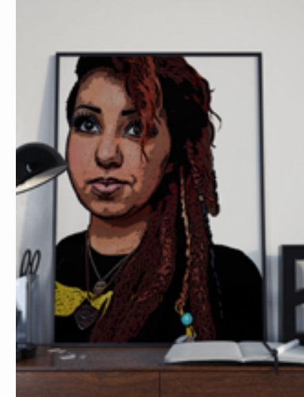
Poster 1 £2.99 Buy | View