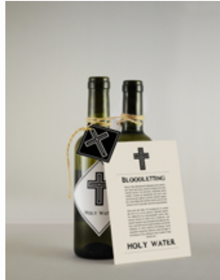
Holy Water £5.99 Buy | View