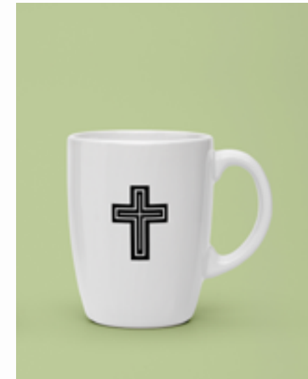
Cross Mug W £3.99 Buy | View