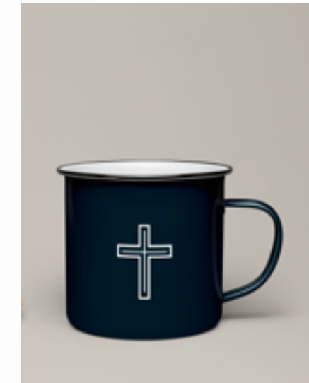
Cross Mug £3.99 Buy | View