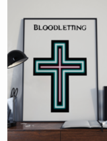
Poster 2 £2.99 Buy | View